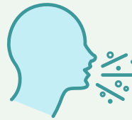
Chambre seule si symptômes respiratoires