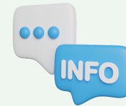
Information au patient et à son entourage