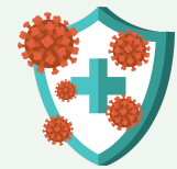
Précautions complémentaires adaptées au mode de transmission