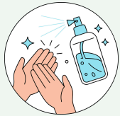
Hygiène des mains

Application des PRECAUTIONS STANDARD pour tout PROFESSIONNEL en tout lieu et pour tous les PATIENTS et tous les SOINS :